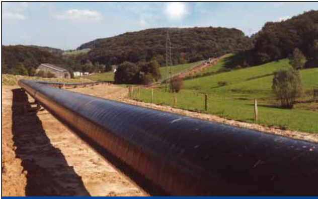
油气管线泄漏监测