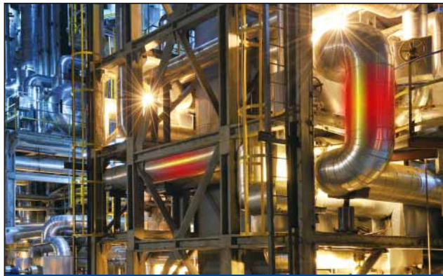
反应塔生产效率监测