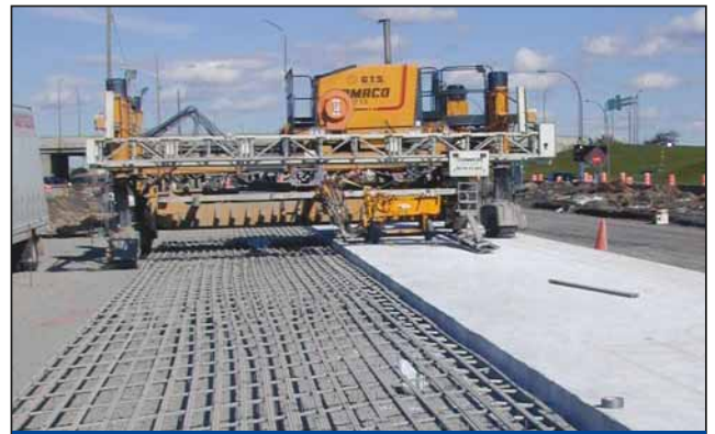
高速公路安全监测